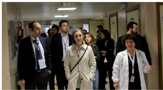
LA VISITA DI UNA STRUTTURA DURANTE LA CONSULTA NAZIONALE ON THE ROAD IN CAMPANIA APRILE 2017

dal contesto nazionale: a maggio 2016 abbiamo potuto osservare da vicino la sanità della Repubblica Ceca recandoci a Praga dopo aver ospitato un importante incontro con l'Ambasciata Ceca; a ottobre abbiamo analizzato, toccandolo