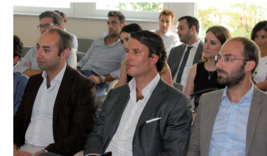
CONSULTA NAZIONALE ON THE ROAD A VERONA

con mano, uno dei migliori SSN al mondo, quello svedese, organizzando un appassionante Study tour in Svezia che ha anche ospitato una delle nostre periodiche Consulte. Abbiamo continuato a muoverci insieme anche in Italia con il format "Consulta Nazionale On the Road", perché il movimento è metafora di curiosità, e nell'aprile 2016 siamo stati a Cotignola e nell'aprile 2017 in Campania.