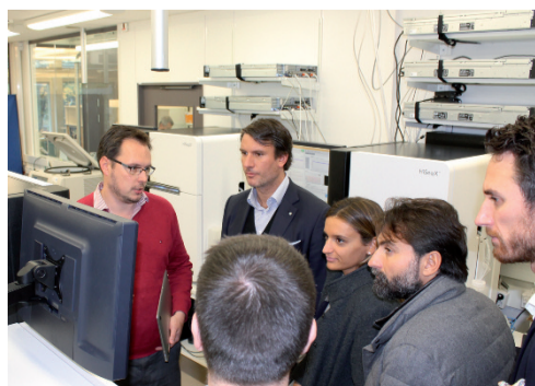
STUDY TOUR SVEZIA 2016

Abbiamo comunicato, perché ritengo che il buon lavoro debba essere raccontato con la giusta enfasi e nelle giuste sedi perché possa essere tanto un esempio, quanto uno stimolo alla crescita di tutti. A maggio 2016, in occasione del cinquantenario dell'Aiop, è stata la volta del Convegno su "L'evoluzione dei modelli sanitari internazionali a confronto", un progetto di ricerca della durata di tre anni - il cui libro poi, è stato presentato presso la sede della Cattolica a no-