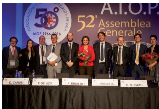
CONVEGNO AIOP GIOVANI A PRAGA, MAGGIO 2016

corso, ad aprile 2016 abbiamo fortemente voluto ed organizzato un Workshop presso la LUISS Business School sulla lean leadership e innovation in sanità, un paradigma totalmente nuovo e rivoluzionario. Abbiamo iniziato a girare l'Europa per capire cosa succedesse fuori