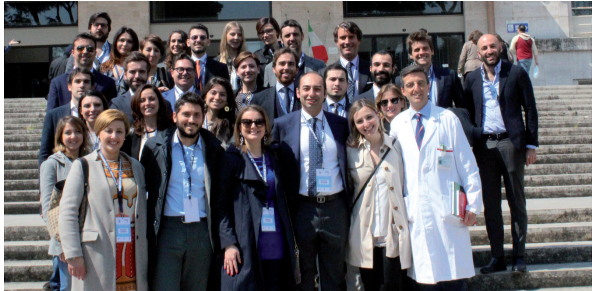
LA VISITA DI UNA STRUTTURA DURANTE LA CONSULTA NAZIONALE ON THE ROAD IN CAMPANIA, APRILE 2017

vembre scorso - che continuerà nella sua analisi anche quest'anno a Palermo, per avere gli elementi per programmare anche in Italia i necessari correttivi, al fine di rilanciare la sanità del nostro Paese. Ci siamo riuniti in tante Consulte e abbiamo trovato sinergie con altri